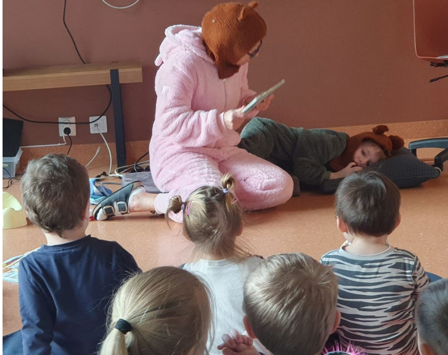
Figur 1 Bilde av barn som leker