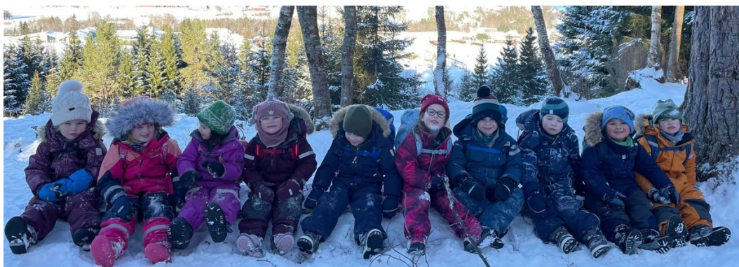
Figur 3 Bilde av barn på tur