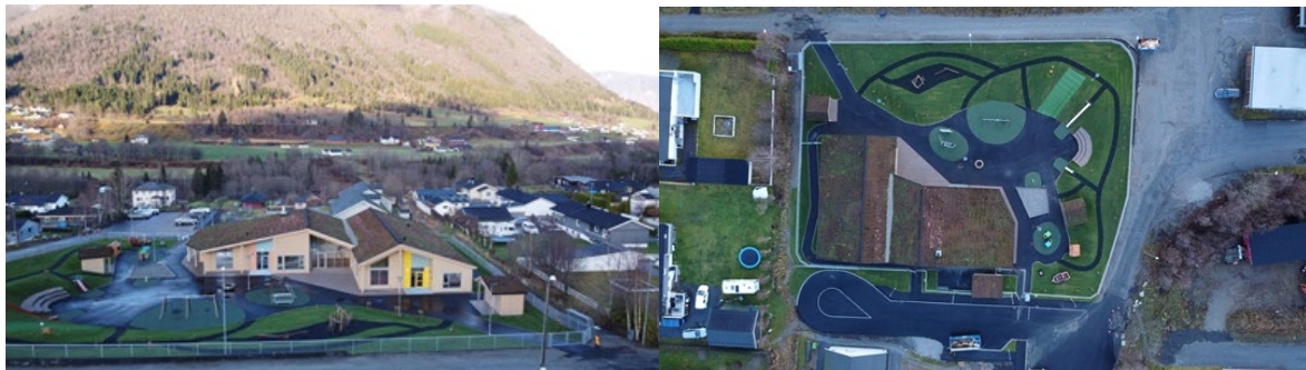
Figur 2 Bilder av måndalen barnehage fra fugleperspektiv