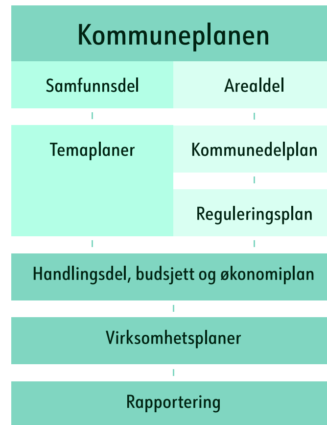
Figuren viser sammenheng mellom de ulike plannivåene

Samfunnsdelen følges opp gjennom handlingsdelen, som er kommunens økonomiplan. Økonomiplanen konkretiserer prioriteringer og tiltak, viser status for gjennomføring og danner grunnlag for bevilgninger gjennom årsbudsjettet.